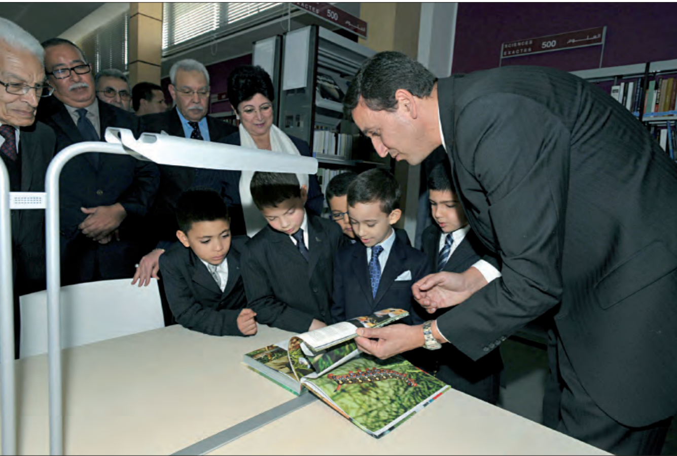
Lire nos informations en page 2